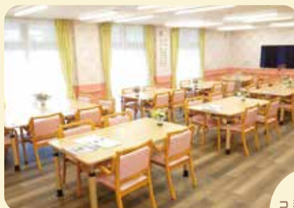
コミュニティ ホール